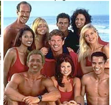
Momo après (en bas à gauche)